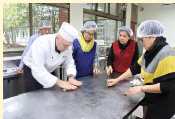
德國麵包師傅教導製作，志工媽媽交流活動