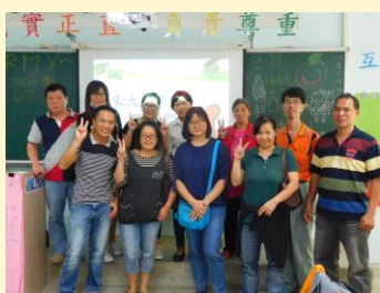
親師溝通班級活動