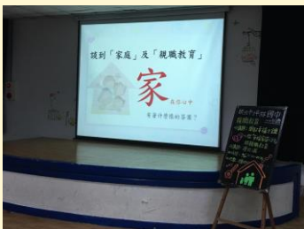
家在你心中有什麼答案