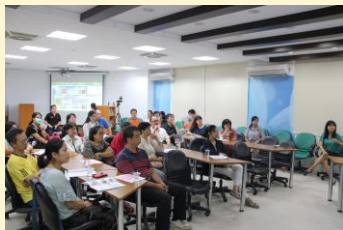
家長專注聆聽升學管道