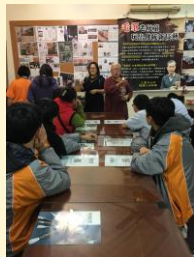
家長參與戶外教學