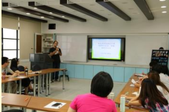
親師座談校內報告