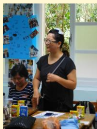
105 學年家長日家長熱烈參與討論