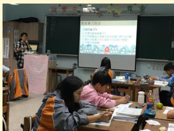
家庭暴力防治宣導