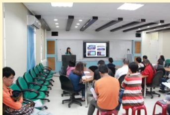
校長向家長報告本年度校內發展目標