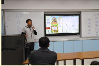
家長日重要事項宣導