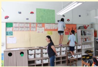
家長參與教室佈置