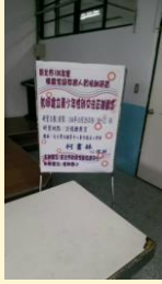
家庭教育人員培訓研習