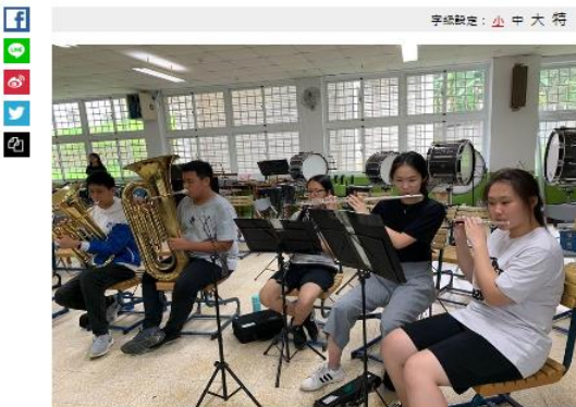
手鼓樂隊：小中大符