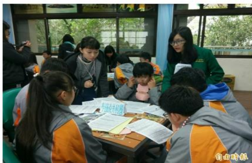
北一女中人文暨社會科學資優班與坪林國中合辦「坪忠信」冬令營活動。

不用抽 不用搶 現在用APP看新聞 保證天天中獎 點我下載APP 按我看活動辦法