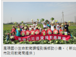
鳳鳴國小生命教育課程到偏鄉助小農。

三重高中的生命教育課程，連結學生圖像「品格力、創新力、探索力、藝術力、國際力」，運用「鳥嶺的具體記憶家族故事」，讓學生追尋家族中長輩故事，展現對生命歷程的省思，位於偏遠山區的坪林國中，將生命教育實踐從學校出發延伸至社區，辦理淨淨、流浪狗園清潔、長者陪伴與社區獨居長者居家清掃活動。