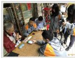
年輕人從長輩的口中聽到先人努力工作的足跡。