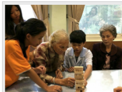
坪林國中生命教育課程到社區陪伴長者，並進行居家清掃。

【記者周淑芸／新北報導】教育部108年度生命教育特色學校獲獎名單出爐，新北市三重高中、坪林國中、鳳鳴國小、雙年國小及雙峰國小皆獲獎，其中，鳳鳴國小建構「愛想鳳鳴」生命教育課程，到偏鄉助小農；坪林國中則辦理淨淨、流浪狗園清潔、長者陪伴與社區獨居長者居家清掃，擴大生命教育的影響層面。