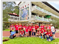
西雅圖志工團連年回台服務，和坪林國中建立深厚感情。(記者翁幸蓮攝)

【記者翁幸蓮／新北報導】二十多位來自美國西雅圖的台灣義工（見圖，記者翁幸蓮攝），十年來每年暑假，就到新北市坪林國中為偏鄉師生辦理為期兩週的英語營，今年邁入第十個年頭，校方及校友非常感謝志工們多年來的付出，舉辦「十年信心之旅」感恩活動，熱情歡迎這些每年有如「侯鳥般南飛」的老朋友。