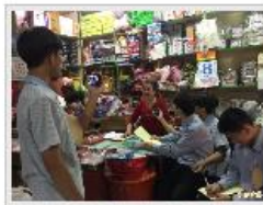
學生採訪耆老問卷、分工合作討論和攝影。

〔記者翁幸煌／新北報導〕台灣進入高齡化世代，地方鄉鎮人口外移嚴重，如何把長輩和先人的歷史和文化傳承下去，成為重要課題。新北市坪林國中近期與振興人共作合作辦理課程，邀請曾經擔任過記者、以及紀錄片導演陳奕璇、林義豐等人，開設文字、聲音及影像工作坊，透過地景繪製、繪本製作、分鏡圖或連續及實地拍攝紀錄等方式，引導學生在過程中學習找出自身與家族、地方的連結，進而帶領學生進入社區，學習紀錄地方文史發展與人物故事，為地方文化再造與保存貢獻一份心力。